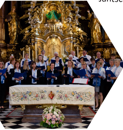
Spiritualkonzert des Hafner-Chors