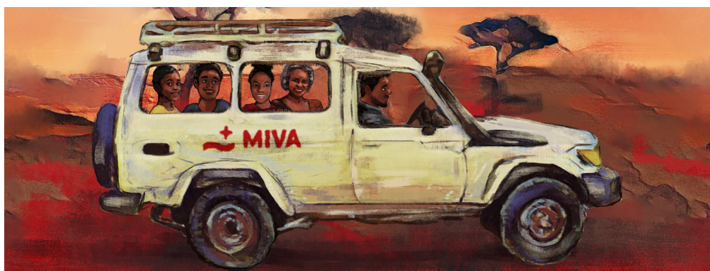
„Einen ZehntelCent pro unfallfreiem Kilometer für ein MIVA-Fahrzeug“ - unter diesem Motto bittet die MIVA bei der Christophorus-Aktion um Spenden.